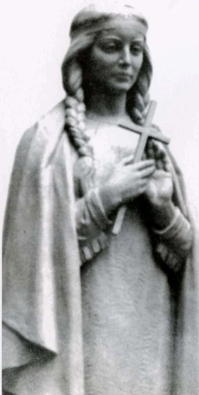
Emile Brunet sculpsit