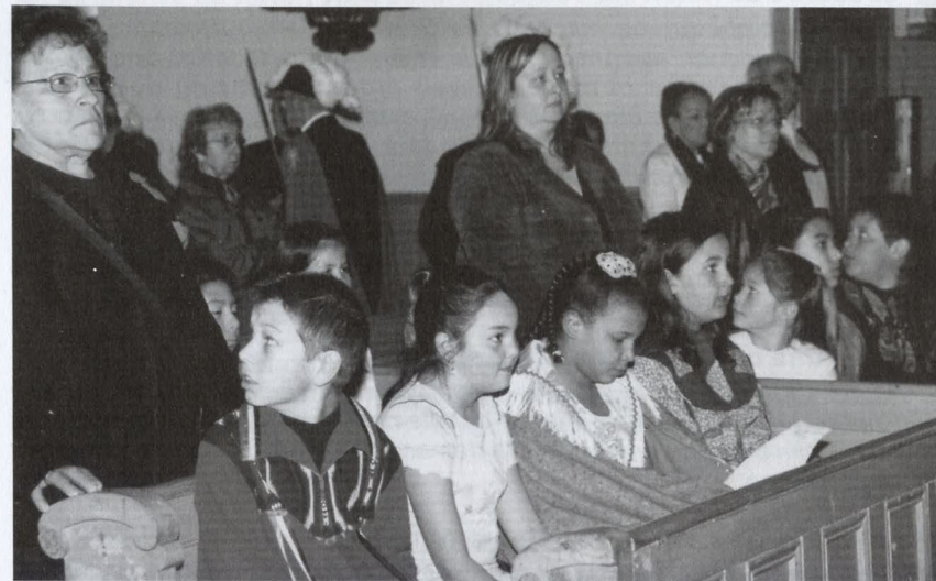
Les enfants du programme « Foi en premier » avec les bénévoles et instructeurs