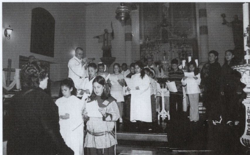
Les enfants du programme « Foi en premier » récitant les prières en Mohawk