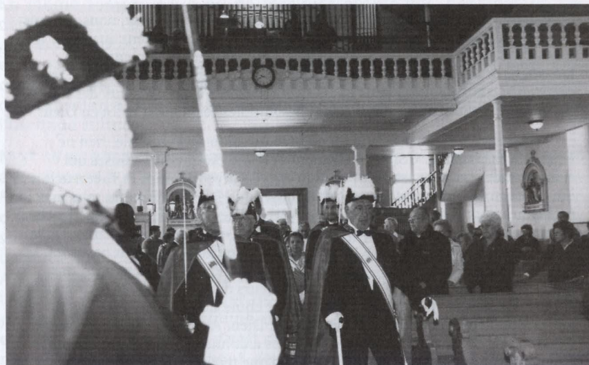
Procession d'entrée lors de la messe pour la fête de la Bienheureuse Kateri